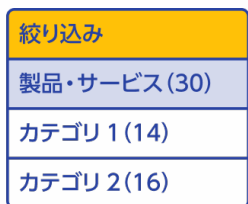
ドリルダウンナビ