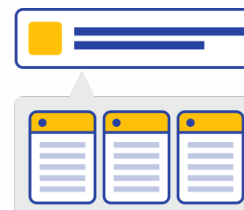
複数ドメインの 横断検索