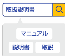
あいまい検索 関連クエリ