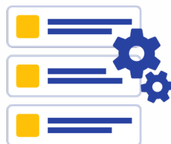
検索結果 カスタマイズ