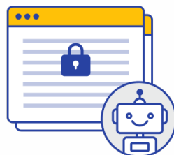
クローズドコンテンツ クロール機能